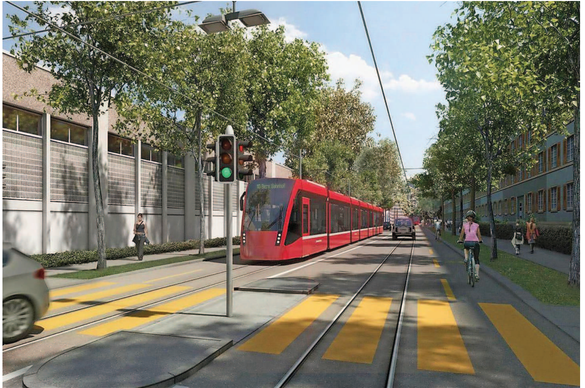
Das Projekt ist nach wie vor umstritten: So sollen Trams dereinst auf der Viktoriastrasse zwischen Bern und Ostermündigen verkehren. Foto: Visualisierung

Beim neu aufgelegten Planungsgenehmigungsverfahren bestehen noch gewisse Widersprüchlichkeiten. So sagte der Bernmobil-Mediensprecher Rolf